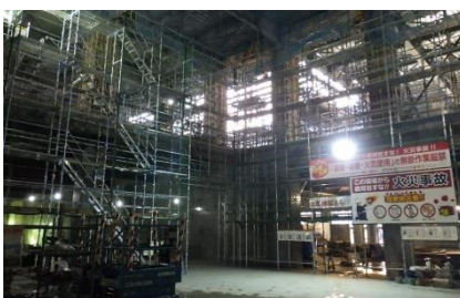
上越の間 (1階ロビー)